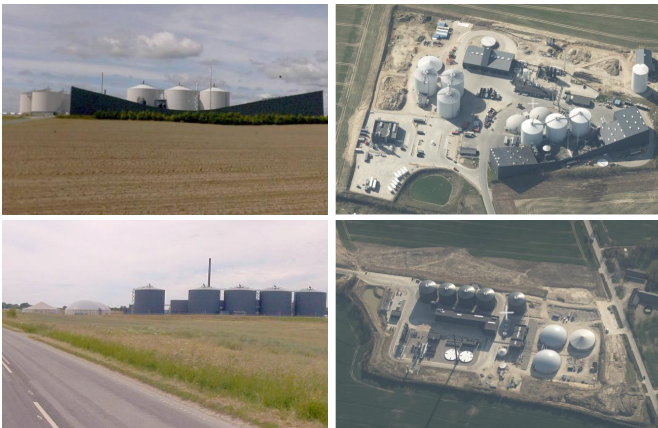
Tabel 1: Biogasanlæg set fra henholdsvis vejsiden (t.v.) og fra luften via Skråfoto.

Nedenstående viser eksempler på allerede etablerede danske biogasanlæg, set henholdsvis fra vejsiden og set fra luften.